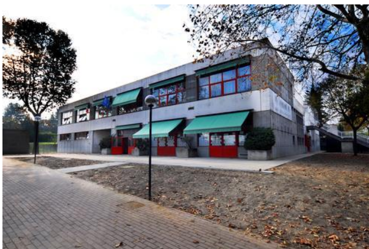
Scuola Primaria "Guglielmo Marconi" Via Giovanni XXIII, 11 - tel. 051 / 845263 40037 Borgonuovo di Sasso Marconi (BO)

ORGANIZZAZIONE DELLA SCUOLA – L'istituto comprensivo di Borgonuovo garantisce il modello orario basato su 27 ore settimanali, distribuite dal lunedì al venerdì, con due rientri pomeridiani. In caso di disponibilità di organico, il modello orario adottato potrà essere esteso per garantire un terzo pomeriggio di attività didattiche.